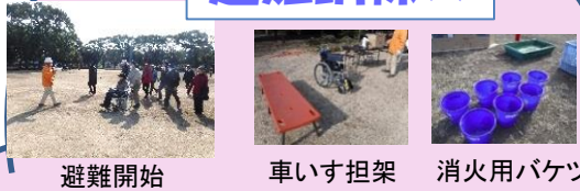
避難開始 車いす担架 消火用バケツ