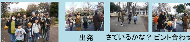
参加者 出発 さているかな? ピント合わせ