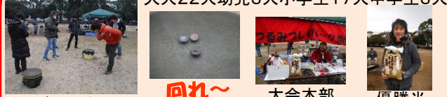
ベーゴマ大会スタート 回れ〜 大会本部 優勝米