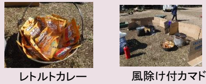
レトルトカレー 風除け付カマド

おどろきました。お米と水を入れたビニール袋でお米が炊き上がるんですね。これさえ覚えていれば、食事に不自由しないです。これは絶対に覚えたいです。水を入れま〜す