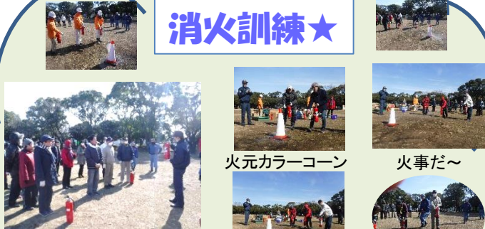
消火器使用方法説明 火元カラーコーン 火事だ～

あせらない 消火器も実際に使った方は数少ないです。やってみると、ノズルを外せない方もいました。経験こそが一番大事です 命ですな