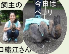
飼主の 今日のは ペコリ キャワイ♡

手作りの衣装を着るととてもかわいい存在でした、これでウサギとカメの競争ができそうですね。