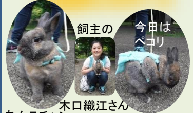
飼主の あんこちゃん 8才です