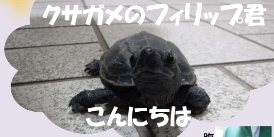
クサガメのフリップ君

私が2才の時に高島屋の屋上で目と目が合い家族となりました。年齢は買った時にすでに10才くらいになっていたと思うのでそれから30年飼っているの40才くらいですかね。なぜ散歩しているかというと、この頃泳ぐのが下手になったので体力を付けるために公園を散歩させていました、おかげ様で、泳ぎも復活しましたヨ! 職員 イヤービックリしました 浦島太郎が来たと思った。