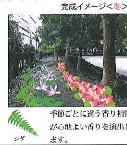
オダマキソウ ヤマアジサイ フイリミズヒキ ホトトギス シダ 季節ごとに違う香り植物が心地よい香りを演出します。